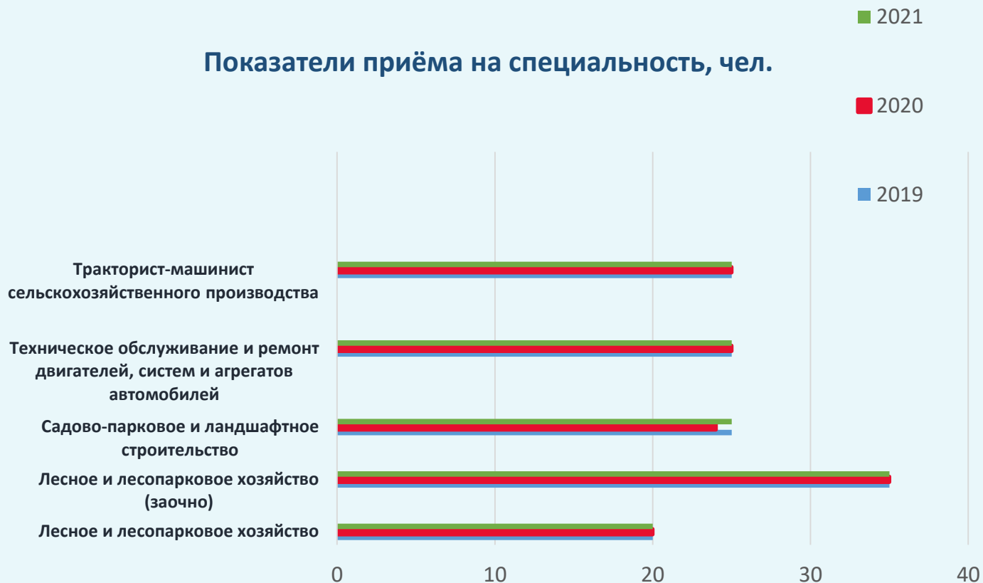
Показатели приёма на специальность, чел.